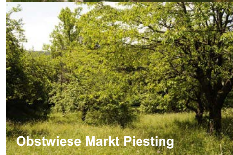
Obstwiese Markt Piesting