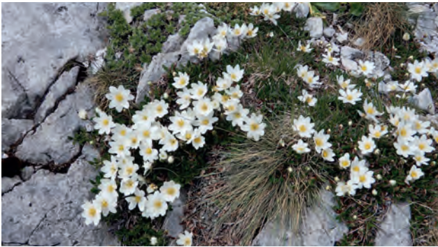
Weißer Silberwurz ( Dryas octopetala )