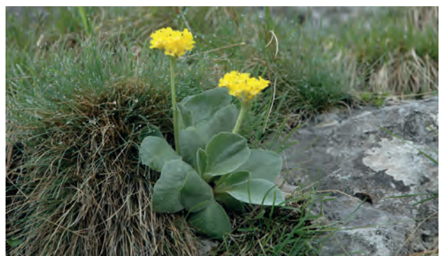
Aurikel ( Primula auricula )