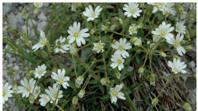
Kärntner Hornkraut ( Cerastium carinthiacum )