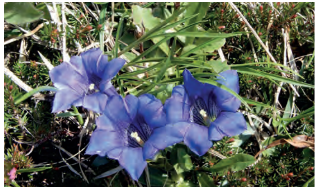
Clusius-Enzian ( Gentiana clusii )