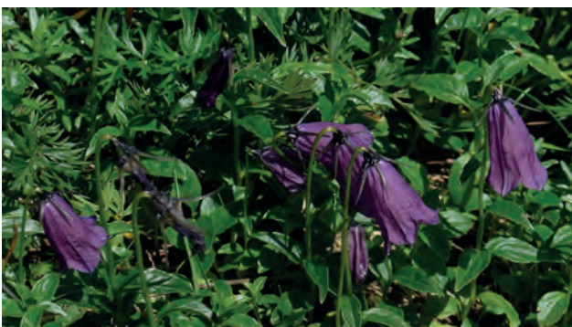
Dunkle Glockenblume ( Campanula pulla )