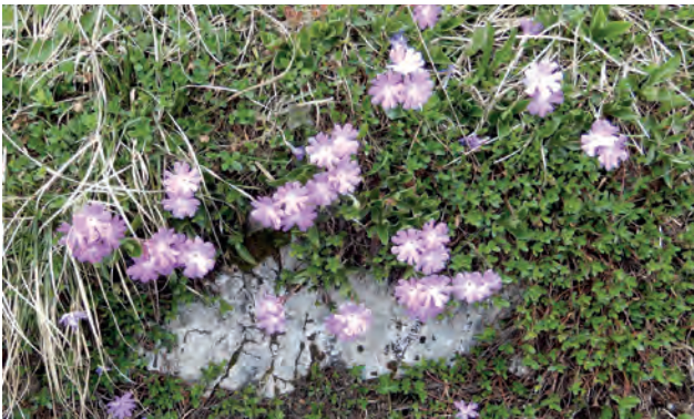
Clusius-Primel ( Primula clusiana )