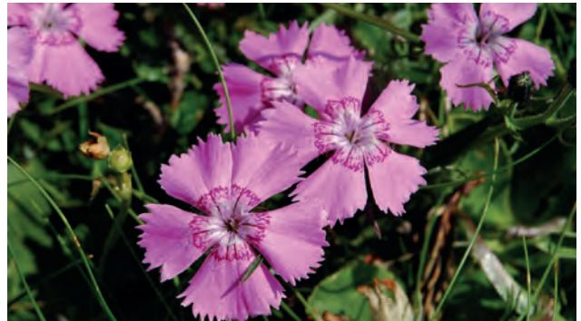
Alpen-Nelke ( Dianthus alpinus )