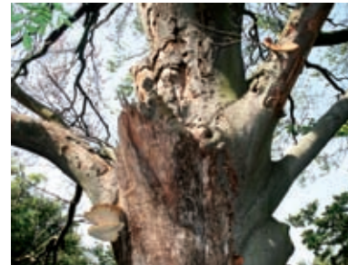
Absterbende Buche – Lebensraum für totholzbewohnende Arten

So karg und abweisend das Plateau des Braunsberges erscheint, so einladend wirken die wärmeliebenden Wälder und Gebüsche an seinen Abhängen. Je nach Untergrund, Steilheit und Sonneneexposition wachsen hier trockene Flaumeichen-Buschwälder, lichte Eichen-Hainbuchenwälder oder Eschen-Schluchtwälder, allesamt europaweit geschützte Waldtypen. Sie zeichnen sich durch einen üppigen Unterwuchs aus. Vor allem im Frühling, wenn das Licht der Sonne noch ungehindert durch die kahlen Bäume einfällt, erblühen hier zahlreiche krautige Pflanzen, so genannte Geophyten, wie das Schneeglöckchen oder das Buschwindröschen.