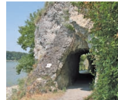
Felsstor am Donaurundweg

Vom Ausgangspunkt an der Schiffsanlegestelle geht es am Ungartor vorbei ein kleines Stück der Donau entlang. Hinter dem Donau-Parkplatz zweigt der Weg nach rechts ab. Er führt entlang des Keltenwegs (rote Markierung) bzw. der Beschilderung „Die Aussichtsreichen Drei“. Man erreicht einen kleinen Felsabsatz und hält sich dort wieder rechts. Oberhalb des Bergbades in Hainburg geht es links hinauf Richtung Braunsberg. Ab der Infotafel zum Naturschutzgebiet Braunsberg führt ein Waldweg in steilen Serpentinauf die Anhöhe des Braunsberges. Weiter führt der Weg über den Parkplatz der Panoramastraße zur keltischen Wallburg. Der Abstieg an der Nordseite des Braunsberges folgt wieder dem rot markierten Keltenweg. Am Fuß des Braunsberges ange-