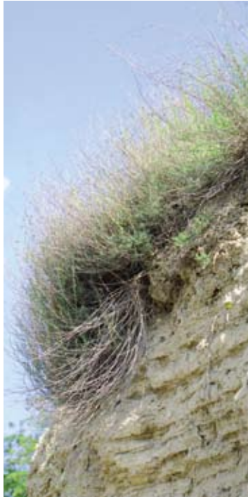
Die Halbstrauch-Radmelde wächst auf den Kellerportalen der Retzbacher Kellergasse und auf Böschungen bei Haugsdorf.

Auf den äußerst trockenen, südexponierten Steilböschungen wächst die Halbstrauch-Radmelde, eine in Österreich sehr seltene, stark gefährdete Pflanze. Der graugrüne Halbstrauch blüht unauffällig, interessant ist jedoch sein Verbreitungsgebiet: Die aus der asiatischen Steppe stammende Pflanze wird in den Steppengebieten Amerikas als Futterpflanze für das Vieh angebaut. Bei den österreichischen Vorkommen, die sich auf die Umgebung von Retz und Haugsdorf beschränken, handelt es sich vermutlich um Relikte der eiszeitlichen Kältesteppen. Die lichtliebende Pflanze reagiert empfindlich auf Beschattung. Vor allem die Überwucherung mit Bocksdorn oder Robinien wird rasch zu einer Bedrohung.