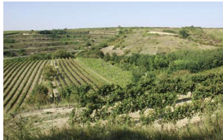
Die reich strukturierte Kulturlandschaft um Haugsdorf ist ein wichtiger Lebensraum für den Steinkauz.

Durch ein spezielles Artenschutzprogramm versucht die Naturschutzabteilung des Landes Niederösterreich das Überleben des Steinkauzes zu sichern: So wird etwa im Raum Retzbach und im Pulkautal die Anlage von Brachen mit Obstbäumen gefördert. Gestaffelte Pflegetermine sollen gewährleisten, dass stets auch kurzrasige Bereiche vorhanden sind, wo der Steinkauz leicht diverse Kleintiere erbeuten kann.