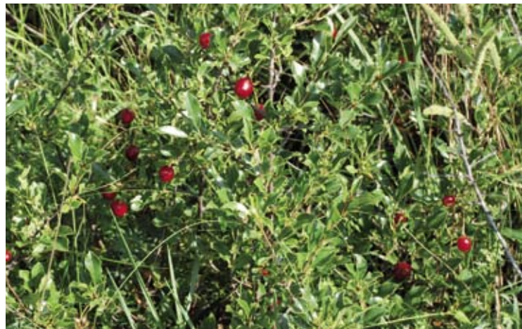
Die sauren Wildfrüchte der Zwergweichsel sind ein willkommener Durstlöscher.

Problematisch ist das Vorkommen der niedrigen Zwergweichsel: Sie überwuchert die Trockenrasenflächen und führt so zu einer Artenverarmung.