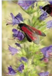
Ein Widderchen labt sich an den Blüten des Natternkopfs.

Wegränder sind in der Kulturlandschaft oft die einzigen Rückzugsräume für Wildpflanzen und Tiere. Diese Flächen werden nicht oder kaum mit Pestiziden behandelt und nur selten gemäht. So gedeihen hier unzählige bunte Blumen, wie Klatschmohn, Ruchlose Kamille, Hainsalbei, Königskerzen und Natternkopf.