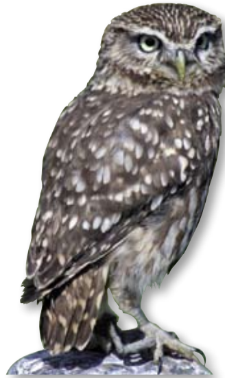
Der Steinkauz lässt sich an seinen hellgelben Augen leicht erkennen.

Der Steinkauz kommt in Österreich heute nur noch im nördlichen Niederösterreich, im Mostviertel, im Wiener Becken und im nördlichen Burgenland vor. Die vom Aussterben bedrohte Eule erreicht die Größe einer Singdrossel und brütet in Höhlen. Baumreiche Wiesen und Streuobstgärten, die besonders im Bereich traditioneller Ortsränder und Kellergassen vorkommen, sind für sie besonders wichtig.