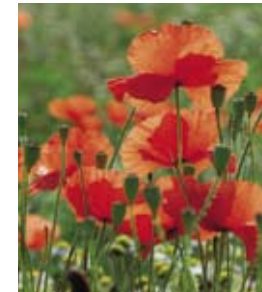
Im Frühsommer erfreut der Klatschmohn Wanderer und Radfahrer.

Wegränder sind in der Kulturlandschaft oft die einzigen Rückzugsräume für Wildpflanzen und Tiere. Diese Flächen werden nicht oder kaum mit Pestiziden behandelt und nur selten gemäht. So gedeihen hier unzählige bunte Blumen, wie Klatschmohn, Ruchlose Kamille, Hainsalbei, Königskerzen und Natternkopf.