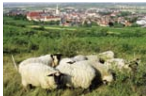
Durch die Beweidung werden die Trockenrasen offen gehalten.

Trockenrasenpflanzen und mit ihnen auch die an die trockenwarmen Bedingungen angepassten Tierarten. So kommt der regelmäßigen Pflege der Trockenrasen eine besondere Bedeutung zu: Dazu gehören die Beweidung mit Schafen und die Entbuschung von mit Rosen und Robinien zugewachsenen Flächen.