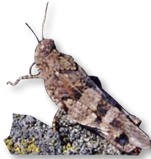
Die Blauflügelige Ödlandschrecke zählt zu den auf die kurzrasige Vegetation der Trockenrasen spezialisierten Tierarten.

Auch das Tierreich weist unzählige Besonderheiten wie beispielsweise seltene Wildbienen, Schmetterlinge und Heuschrecken auf, die alle vom Blütenreichtum profitieren.