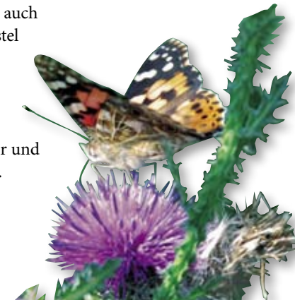
Der Nektar der Weg-Distel ist eine willkommene Nahrung für den Distelfalter.

Der Blütenreichtum des Wegrandes ist vor allem auch für Schmetterlinge von großer Bedeutung. Disteln spielen als über lange Zeit blühende Nektarpflanzen eine besondere Rolle. Entlang des Natura Trails kommen neben der recht häufigen Weg-Distel auch die hochwüchsige Eselsdistel und die blaue Kugeldistel vor. An ihnen laben sich zahlreiche Schmetterlingsarten wie der Distelfalter, der Schachbrettfalter und das Große Tagpfauenauge.