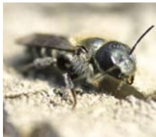
Mauerbienen gehören zu den solitär lebenden Wildbienenarten.

Typische tierische Bewohner der Steilböschungen sind Wildbienen, die ihre Brutröhren in die steilen Böschungen graben. Auch die äußerst scheuen Kaninchen legen ihre Höhlen im leicht bearbeitbaren Löß an und schaffen so offene Standorte, die der Halbstrauch-Radmelde zu Gute kommen.