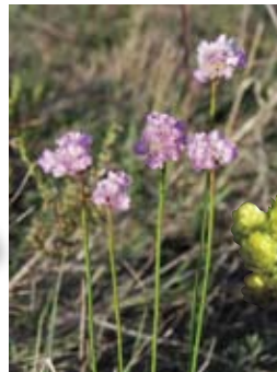
Sand-Grasnelke und Sand-Strohblume: zwei stark gefährdete Trockenrasenarten.

Auch Einjährige wie der stark gefährdete Dillenius-Ehrenpreis und das Raue Vergissmeinnicht verfolgen eine besondere Strategie, die Trockenheit des Sommers zu umgehen: Diese Winzlinge keimen im Herbst, blühen und fruchten im Frühjahr und überdauern den Sommer im Samenstadium.