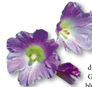
Die Stockmalve zählt zu den vom Aussterben bedrohten Pflanzenarten.

Zu den Besonderheiten zählt die Stockmalve oder Pappelrose. Diese heute extrem seltene Art ist vermutlich die Stammsippe der Garten-Malven. Sie blüht im Sommer und Frühherbst und kann entlang der Natura Trail Variante zwischen Südmährer Denkmal und Seebachtal beobachtet werden.