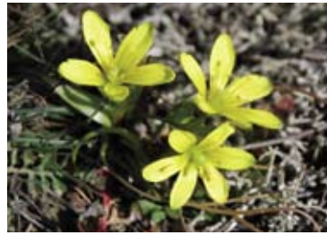
Der Böhmische Gelbsterne überdauert den trockenen Sommer unterirdisch als Zwiebel.

Trockenrasen zeichnen sich durch einen besonderen Blütenreichtum aus. Im zeitigen Frühjahr, noch vor der Kuschelle, öffnet der stark gefährdete Böhmische Gelbsterne seine Blüten. Er ist optimal an die Trockenheit angepasst: Die Blätter überdauern den feuchten Winter grün und werden im Sommer eingezogen.