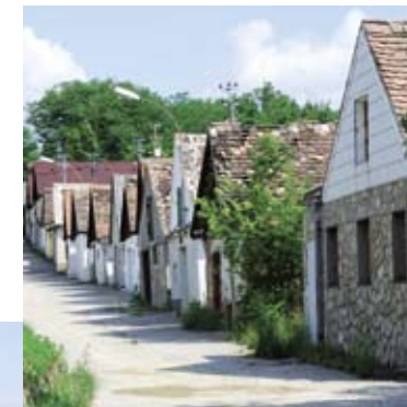
Charakteristische Kellergasse in Haugsdorf.

Wegbeschreibung: Vom Bahnhof Retz führt die Radroute über den historischen Retzer Hauptplatz durch das Verderberhaus über die Windmühlgasse steil zur Retzer Windmühle mit den umgebenden Trockenrasen hinauf. Von dort genießen wir den Ausblick auf Retz und die Weinbaulandschaft und folgen dem Weg weiter nach Osten Richtung Hofern. Nach ca. 200 m biegen wir auf einer kleinen Trockenrasenkuppe nach rechts in einen asphaltierten Weg Richtung Altstadt ab, der hinunter ins Tal führt. Achtung: ein Teilstück ist sehr grob gepflastert!