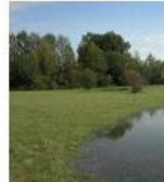
Ansteigendes Grundwasser in der Feuchten

Der als Feuchte Ebene bezeichnete Bereich des Beckens zeichnet sich durch seine wassertrüben und das hoch an aus. Ursprung des großen Grundwasserndorfers Senke ist das Wasser der F das den gewaltigen Schotterkörper und hier wieder zu Tage tritt. Zahllose, Niedermoore, Pfäferswiese, Eschen-Auen zeugen vom großen Element auf die Landschaft.